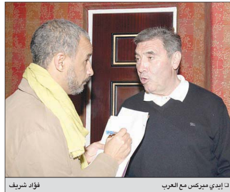
إيدي ميركس مع العرب فؤاد شريف